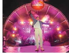
Caraguã Ta Show