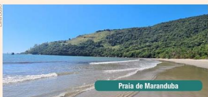
Praia de Maranduba