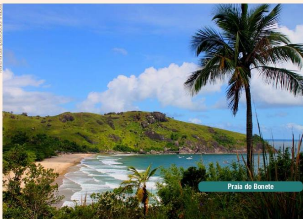
Praia do Bonete

Localizada entre os rios Guaratuba e Itaguapé, a praia oferece um mar aberto com