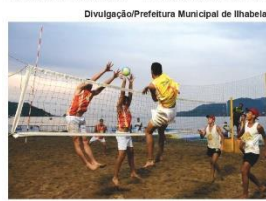
Festival de Verão Viva Ilhabela

Consulte um receptivo local para garantir a qualidade e ter informações de cada passeio em: circulitoralnorte.tur.br/guia geral