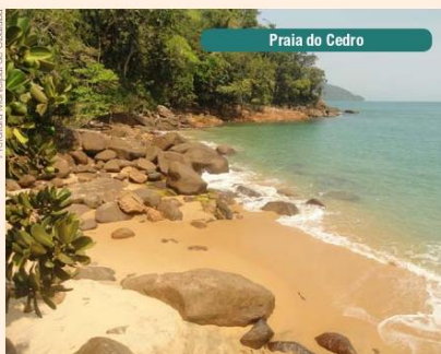
Praia do Cedro