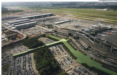
Mais de 41,1 milhões de pessoas utilizaram o aeroporto internacional de Guarulhos, que superou movimento de passageiros de El Dorado, em Bogotá, na Colômbia

Considerando aeroportos da América Latina, o aeroporto administrado pela GRU Airport é superado apenas pelo Benito Juárez (AJCM), na Cidade do México. Um corte das autorizações de pousos e decolagens (slots), pode resultar na diminuição de passageiros no AJCM.