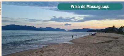
Praia de Massaguaçu