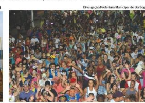
Carnaval de Bertioga