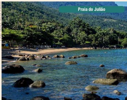
Praia do Julião

Para viver o melhor da Região Turística, acesse o guia de fornecedores locais: https://circuitolitoralnorte.tur.br/guiageral