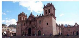
Catedral Basílica de la Virgen de la Asunción, principal templo em Cusco, Peru

Lima, a capital peruana, encanta turistas do mundo todo com seu belíssimo Centro Histórico e o sítio arqueológico Huaca Pucllana. Animada vida noturna da cidade tem vários bares, principalmente nos bares e baladas do bairro Barranco. A gastronomia é mais um atrativo. Entre os restaurantes mais conceituados está o Astrid y Gastón, do chef Gastón Acurio, que já foi eleito o melhor da América Latina na lista The World's 50 Best Restaurants, organizado pela revista britânica Restaurant. Além de atrair pontos turísticos que merecem ser visitados, como a Plaza de Armas, a Catedral e o sítio arqueológico de Sacsayhuamán, Cusco é ponto de partida para as ruínas incas de Machu Picchu. Também é possível percorrer a Rota do Barroco Andino, que inclui quatro belos templos.