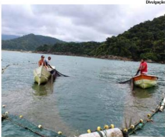
Rota Caiçara, em São Sebastião

No roteiro, além de conversar com moradores antigos, que contam sobre a história do povo (como viviam, costumes, divisão de tarefas, aspectos da religião e o que aconteceu com o povo