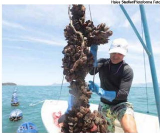
Fazenda de Mexilhão da Cocanha, em Caraguatutuba

O Litoral Norte de São Paulo é um destino que reúne não só belezas naturais exuberantes, como também muita história e cultura de seus povos tradicionais caiçaras, quilombolas e indígenas.