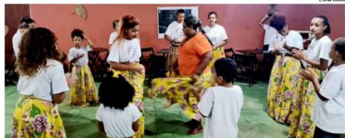
Jongo no Quilombo da Fazenda, em Ubatuba