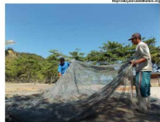
Castelhanos, em Ilhabela

Conheça mais sobre o Litoral Norte de São Paulo acessando: www.circuitolitoralnorte.tur.br