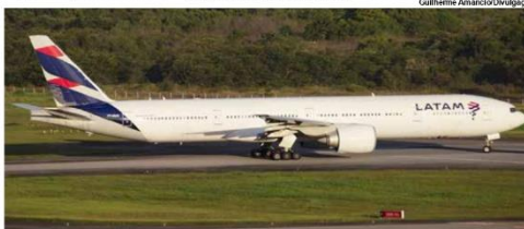
Boeing 777-300ER no aeroporto de Guarulhos, principal centro de conexões da Latam, que transportou 7,7 milhões de passageiros no primeiro trimestre e manteve a liderança no mercado brasileiro

A Latam planeja transportar 40 milhões de passageiros em voos domésticos e internacionais no Brasil em 2023, uma alta de 25% frente 32 milhões transportados no ano passado. A oferta de assentos da companhia no país está próxima dos níveis registrados em 2019.